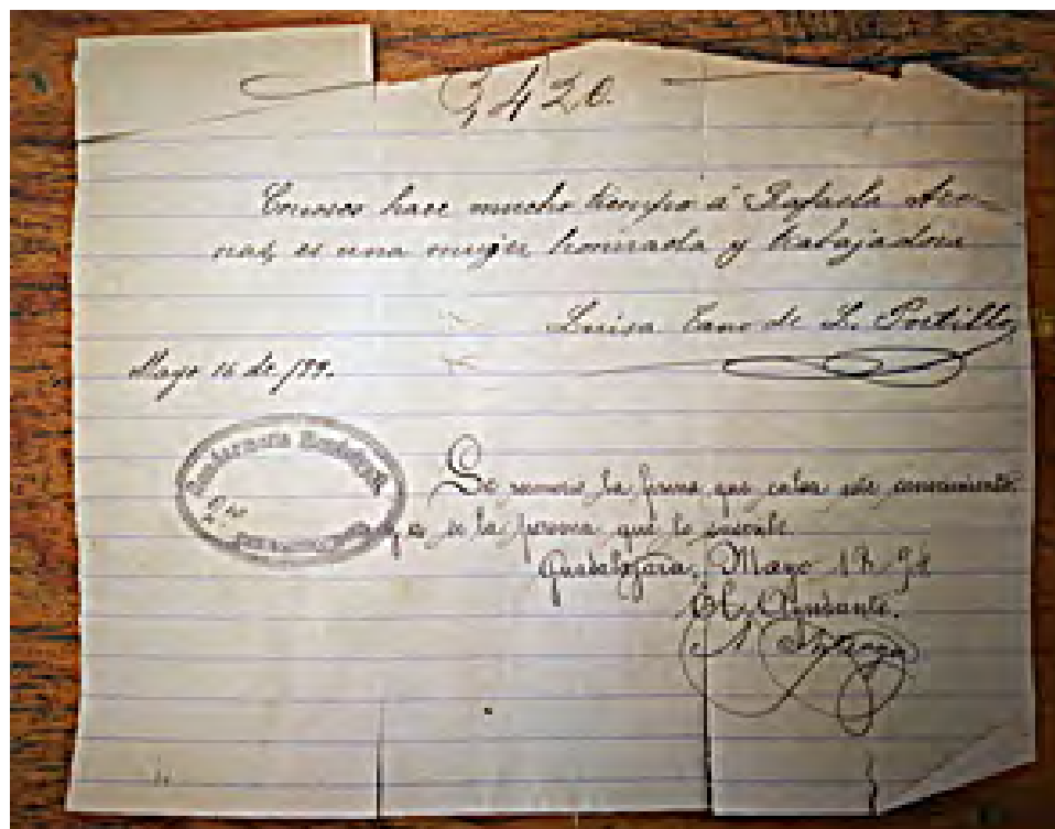
Figura 4. Carta de recomendación. Testigo encontrado en el libro de trabajadores domésticos del Archivo Municipal de Guadalajara.

En los Libros de Registros también se hacen anotaciones sobre si el solicitante fue despedido y los motivos. En algunas ocasiones, entre las páginas de los libros que se revisaron y fotografiaron, se localizaron algunos documentos ajenos a los registros; son del tipo de vestigios documentales a los que se denomina “testigos” 5 . Se encontraron por ejemplo, algunas cartas de recomendación que el solicitante llevó y que quedaron colocadas en la página en la cual se asentó el registro.