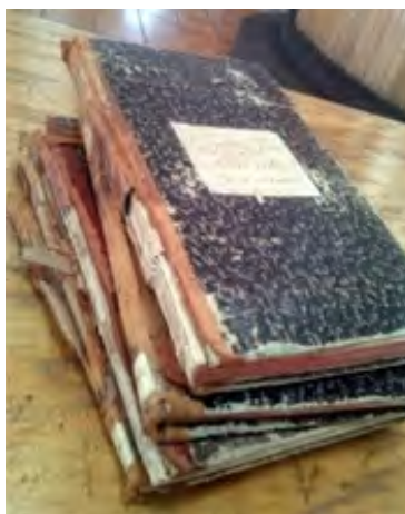
Figura 1. Fotografía de algunos ejemplares de Registro de Oficios del AMG

El Archivo Municipal de Guadalajara “Salvador Gómez García” es el recinto que alberga el patrimonio documental de la ciudad. Su edificio consta de una torre de seis niveles y sótano, los muros son dobles con el fin de evitar que penetre la humedad y lograr una temperatura constante en el interior. La entrada principal desemboca en un patio distribuidor, con una pequeña fuente central y amplios corredores cubiertos con arcadas; este patio da acceso a la librería y las oficinas directivas, el área administrativa, a la biblioteca, a la sala de investigadores, a los salones de juntas y a otras áreas del edificio. 4