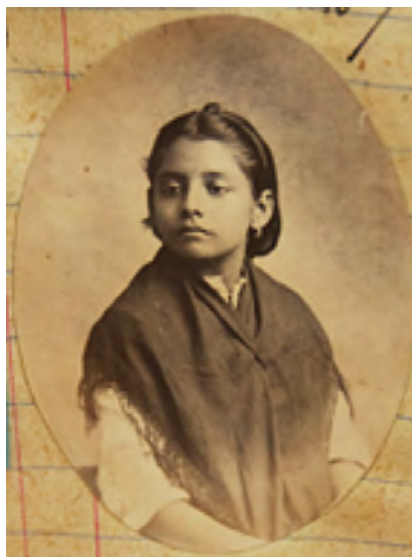
Figura 7. Fotografía del libro de Trabajadores Domésticos del Archivo Municipal de Guadalajara.

Gracias a la breve información que se encuentra en los libros, se puede apreciar que muchos de los solicitantes provenían de diversas poblaciones y ciudades del occidente de México. Encontramos habitantes de Cocula, Zacoalco, El Grullo, Arandas, Tepatitlán y también de Aguascalientes, quienes vivían en domicilios de los barrios de Analco, de Mexicaltzingo, de San Juan de Dios y de la Capilla de Jesús.