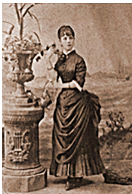
Figura 5. Fotografía de tipo carta de visita incluida como parte del registro en el Libro de Registros de trabajadores domésticos del Archivo Municipal de Guadalajara.

Pocos años después, para 1880, la evolución técnica y óptica tanto de los lentes como de las cámaras fotográficas permitió obtener imágenes más precisas y acercamientos de tres cuartos o de medio cuerpo. Entonces fue posible destacar mejor la fisonomía del retratado, lo cual fue ideal para cumplir con el objetivo de tener una fotografía adecuada para el registro y las cartillas de identidad, como se puede apreciar en los registros de los que aquí se aborda (Eaton, 1987).