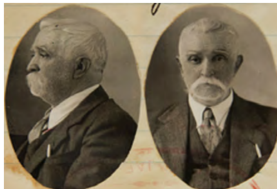
Figura 6. Fotografía del Libro de Boticas del Archivo Municipal de Guadalajara.

Algunas imágenes son de buena calidad estética. Como ya se mencionó, seguramente una cantidad importante la tomaron fotógrafos ambulantes que se instalaban por el rumbo del manantial del Agua Azul o en las cercanías del tradicional mercado de San Juan de Dios. Estas son fáciles de detectar debido a la sencillez de su iluminación, a la carencia de utilería y a la falta de técnica académica; por el contrario, las imágenes realizadas en estudio se identificaron por el cuidado de la composición, el uso de elementos de utilería y los fondos decorados.