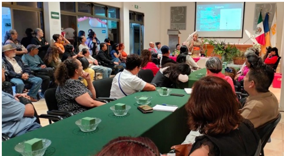
Figura 5. Imagen de la presentación de ikebana, fotografía tomada por la autora