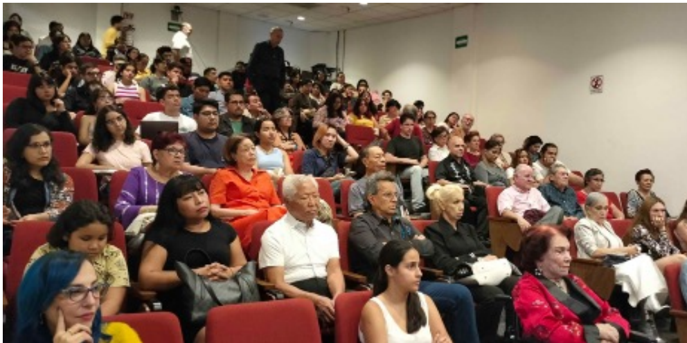
Figura 3. Público durante el conversatorio Japón en México.