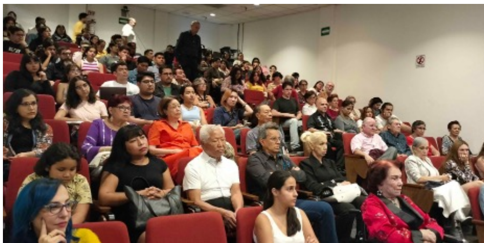
Figura 3. Público durante el conversatorio Japón en México.