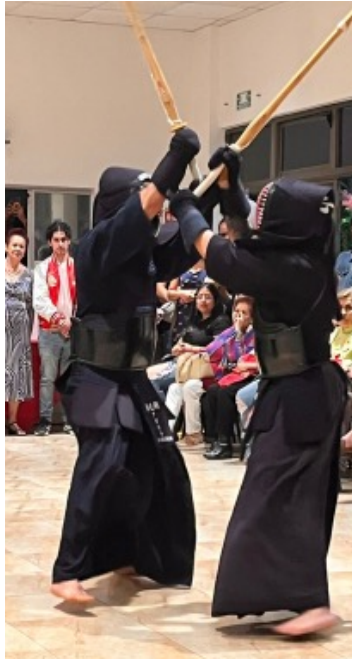
Figura 4. Atletas de kendo realizando sus ejercicios, fotografía tomada por Rubén Navarro Vargas.

Estos atletas conectaron con el público enseñándoles sobre las artes marciales de una manera amigable, así como responder a todas las preguntas que surgían por parte del público. Fue una actividad didáctica que dejó una agradable impresión al público.