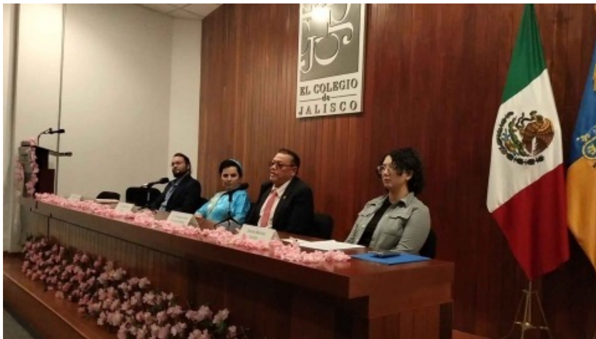
Figura 2. Conversatorio Japón en Jalisco.

Esta asociación está dedicada a fortalecer los lazos entre México y Japón en el estado de Jalisco. El tema de su conversatorio fue La presencia Nikkei en el Estado de Jalisco , donde nos relató sobre la historia y el desarrollo de las familias Nikkei que llegaron a asentarse en la Zona Metropolitana de Guadalajara a lo largo de los años y las diversas razones por las que llegaron a Jalisco.