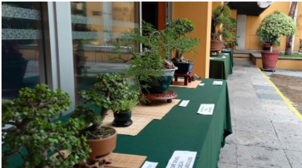
Figura 1. Instalación de la exhibición de árboles bonsái.

En las instalaciones del Colegio de Jalisco, fueron testigo de la primera edición de Japón Matsuri “Japón en Jalisco”. Entre guirnaldas de flores de cerezo, faroles japoneses y árboles de bonsái, se llevarían a cabo las actividades de este festival centradas en la cultura tradicional del Japón.