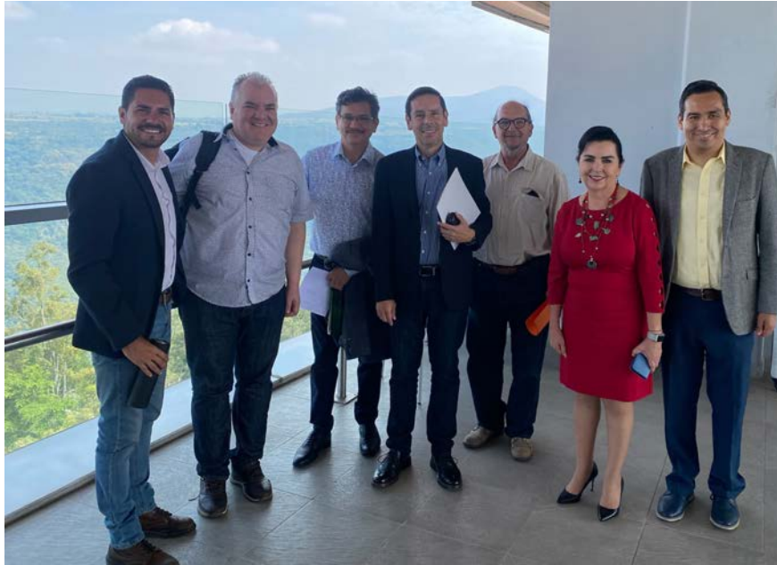
Figura 6. Coloquio semestral con miembros de la maestría