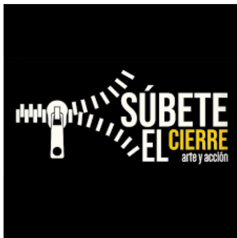
Figura 1. Logotipo Súbete el Cierre , diseño gráfico Cristina Martínez Avendaño

La gestión cultural no se hace desde el escritorio; fomentamos el espíritu de servicio, de trabajo en equipo, utilizando herramientas a partir de metodología específica para cada caso. Se debe iniciar con una investigación in situ para la información recabada mediante encuestas, entrevistas y cabildeo, y entonces pensar, reflexionar, meditar, mentalizar y teorizar, para poner en acción el proyecto ejecutivo, el cual es acompañado por el cuerpo académico del posgrado; además de que contamos con amplísimo abanico de asesores y directores de tesis 5 Se han realizado proyectos ejecutivos verdaderamente impresionantes que han impulsado el desarrollo económico y social de sus habitantes. Hemos trabajado en comunidades a lo largo y ancho del país, desde los estados de Quintana Roo, Campeche, Puebla, Colima, Durango, Baja California, Sinaloa, Aguascalientes, Ciudad de México y por supuesto en Jalisco.