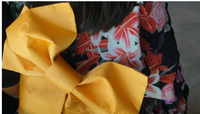
Figura 5. Yukata estampada negra con obi japonés, 24 de marzo 2024.

El trabajo en equipo es una práctica cotidiana entre alumnos y académicos. De nueva cuenta la pandemia propició que iniciáramos la revista Horizontes de la Gestión Cultural 7 en enero del 2021 donde publicamos los avances de las investigaciones generadas de manera conjunta entre alumnos y académicos. El ver su nombre en una publicación, motiva mucho a los alumnos a participar. Actualmente se tienen siete números publicados de manera virtual. La difusión es básica en la gestión cultural y la virtualidad es nuestra aliada.