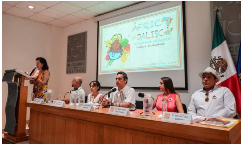
Figura 4. Presentación del proyecto "África en Jalisco" en las instalaciones del Colegio de Jalisco

El trabajo en equipo es una práctica cotidiana entre alumnos y académicos. De nueva cuenta la pandemia propició que iniciáramos la revista Horizontes de la Gestión Cultural 7 en enero del 2021 donde publicamos los avances de las investigaciones generadas de manera conjunta entre alumnos y académicos. El ver su nombre en una publicación, motiva mucho a los alumnos a participar. Actualmente se tienen siete números publicados de manera virtual. La difusión es básica en la gestión cultural y la virtualidad es nuestra aliada.