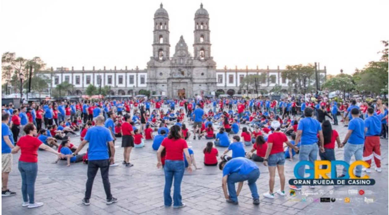
Figura 17. Gran Rueda Casino en Plaza de las Américas.