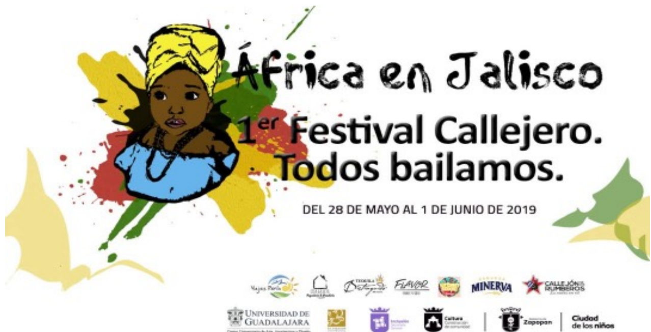
Figura 2. Cartel de invitación para el festival realizado por Cultura Zapopan