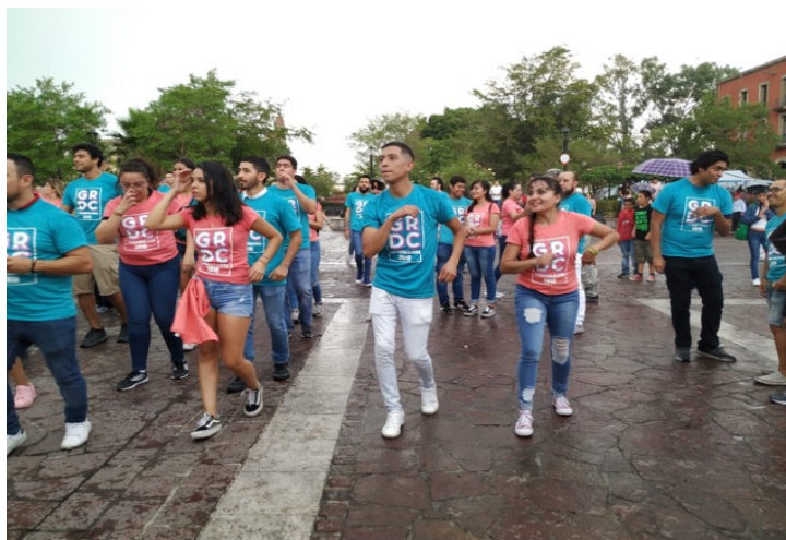
Figura 6. Gran Rueda de Casino 2019.