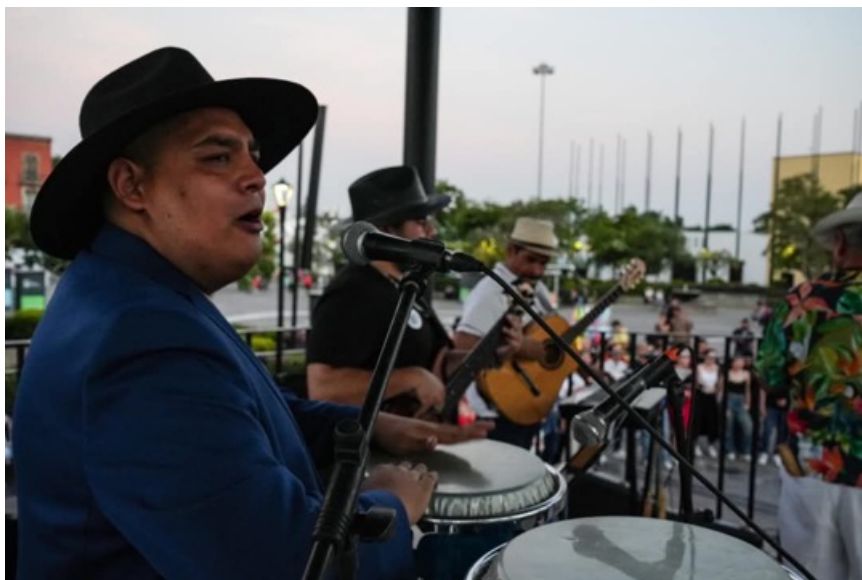
Figura 15. Concierto tributo a Buena Vista Social Club por el grupo Son de Buenavista en Plaza de las Américas.