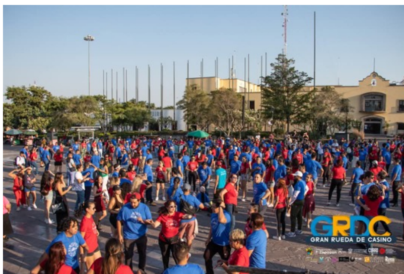
Figura 16. Gran Rueda Casino en Plaza de las Américas.

La Gran Rueda Casino es el momento en donde todos los casineros se juntan, la rueda se canta y los bailarines van cambiando de pareja. No solo es un deleite participar, sino también observar. Ver tanta gente unida, coordinada y divertida es toda una experiencia. Lamentablemente, no pudimos usar el dron para filmar porque se tenían que pedir los permisos con antelación, así que cada que alguien volaba su dron, inmediatamente la policía se ponía a buscar al dueño. Sin embargo, ya sabemos que para futuras intervenciones, debemos de realizar una carta para el uso del artefacto.