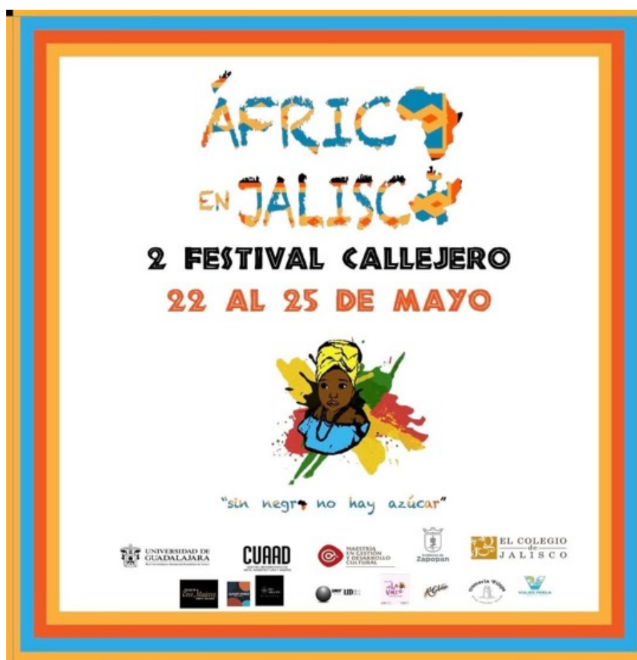
Figura 8. Folleto y diseño realizado por Diego Guridi.

Las fechas seleccionadas para este festival fueron del 22 al 25 de mayo y mis patrocinadores fueron: Viajes Perla, Cremería Filepa, A lo Cubano, Restaurante La Vale, Tequila Tres Mujeres, Neo Creación, Flavor Dance Studio y Betlighting.