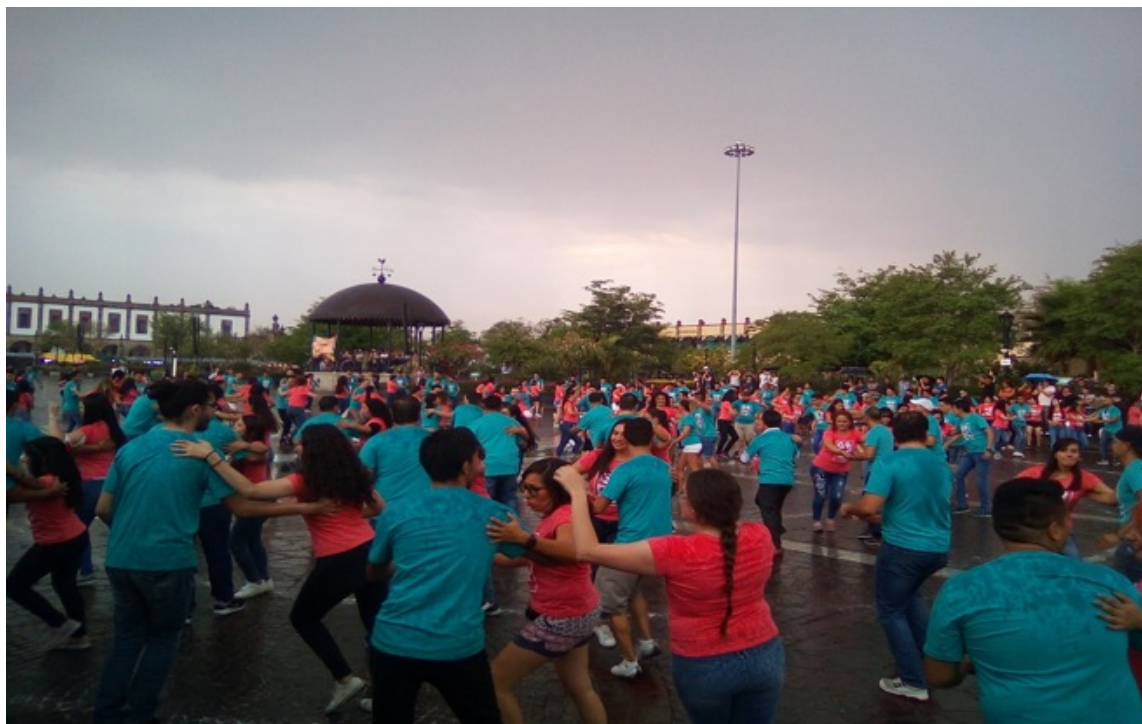
Figura 5. Gran Rueda de Casino 2019.

Cuando se cerró el festival, tuve si acaso 10 días para subir resultados a mi tesis para poder titularme. Logré la titulación a finales de junio, pero sabía que el festival aun no había terminado.