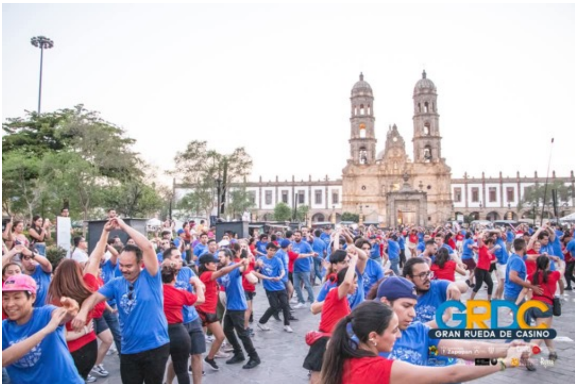
Figura 18. Gran Rueda Casino en Plaza de las Américas.