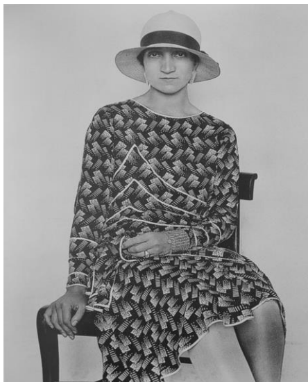
Figura 1. Antonieta Rivas Mercado (1900-1931)