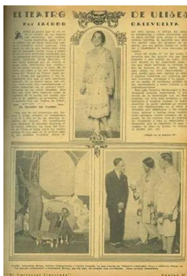
Figura 5. El teatro de Ulises