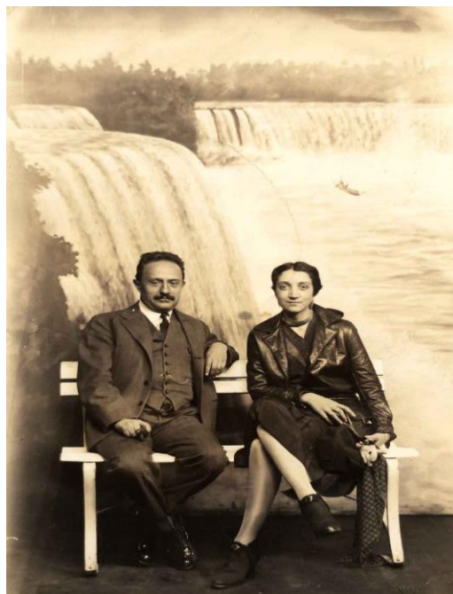
Figura 7. José Vanconcelos y Antonieta Rivas Mercado. Diciembre de 1929.

El vestíbulo del hotel se tornó luminoso cuando me la presentaron...con naturalidad se estableció de inmediato una inteligencia perfecta entre nosotros...una de las más grandes mujeres que el país ha producido en los últimos tiempos...despilfarraba su fortuna en el sostenimiento de una Sinfónica, edición de revistas literarias selectas y en los trabajos de un teatro de minorías titulado “Ulises”. (Vasconcelos, 1946)