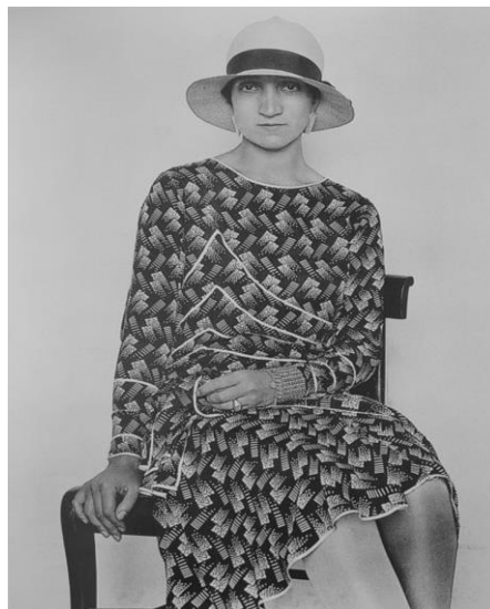
Figura 1. Antonieta Rivas Mercado (1900-1931)