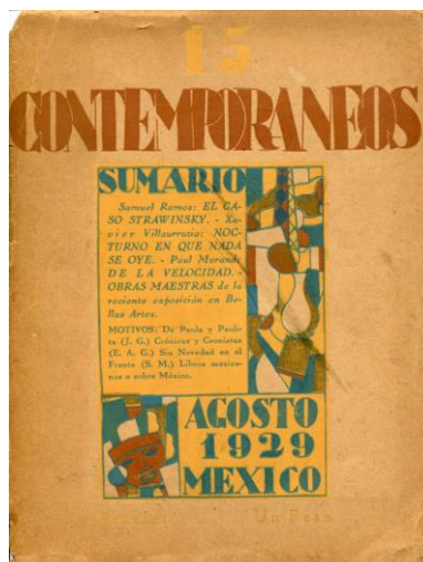
Nota: González (2016).