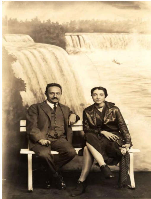
Figura 7. José Vanconcelos y Antonieta Rivas Mercado. Diciembre de 1929.

El vestíbulo del hotel se tornó luminoso cuando me la presentaron...con naturalidad se estableció de inmediato una inteligencia perfecta entre nosotros...una de las más grandes mujeres que el país ha producido en los últimos tiempos...despilfarraba su fortuna en el sostenimiento de una Sinfónica, edición de revistas literarias selectas y en los trabajos de un teatro de minorías titulado “Ulises”. (Vasconcelos, 1946)