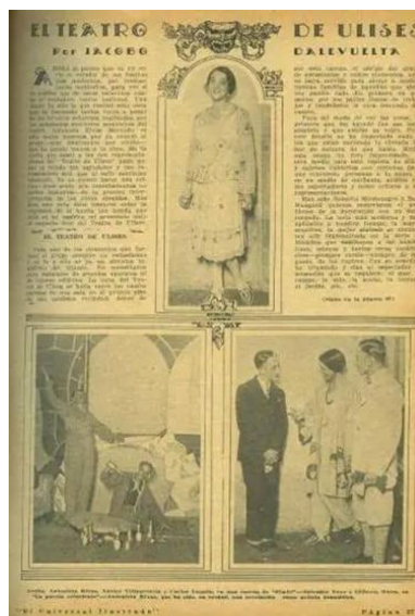
Nota: Ortiz Bullé Goyri (s.f.)

Entrevistada por el periódico El Universal Ilustrado, en mayo de 1928, Antonieta expresaba que había que iniciar con un teatro mexicano que estuviera lejos de los estereotipos de “mexicanidad” que otros intelectuales posrevolucionarios promocionaban, porque “lo que ha dado en llamarse teatro mexicano es una vergüenza para la intelectualidad mexicana, ya que lo mexicano no se define en torno al folclore tradicionalista” (García Gutiérrez, 1999, p. 617).